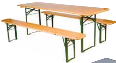
CONJUNTO DE MADERA MACIZA CONJUNT DE FUSTA MASSISSA