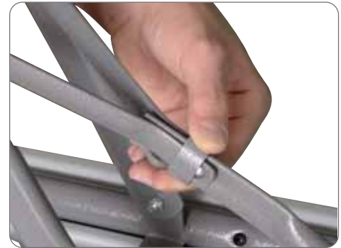
SISTEMA DE SEGURIDAD ANTICIERRE ACCIDENTAL SISTEMA DE SEGURETAT ANTI-TANCAMENT ACCIDENTAL