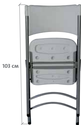
VISIÓN FRONTAL PLEGADA VISIÓ FRONTAL PLEGADA