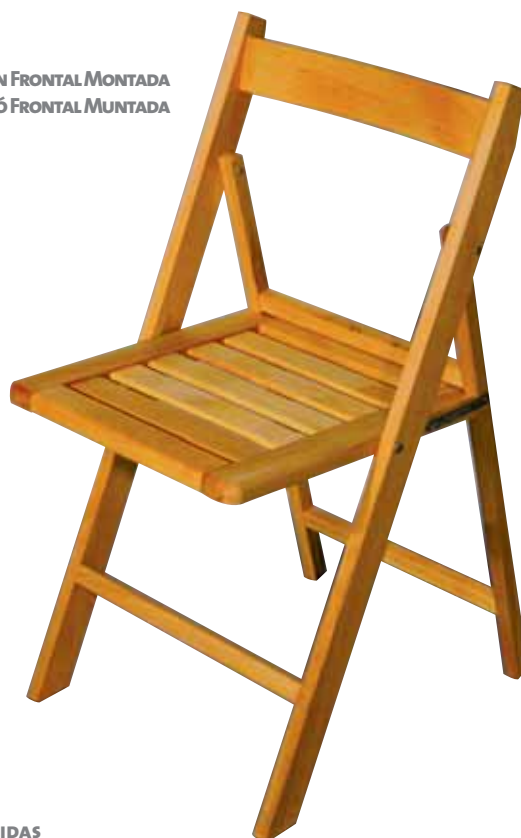
DIMENSIONES Y MEDIDAS DIMENSIONS I MESURES