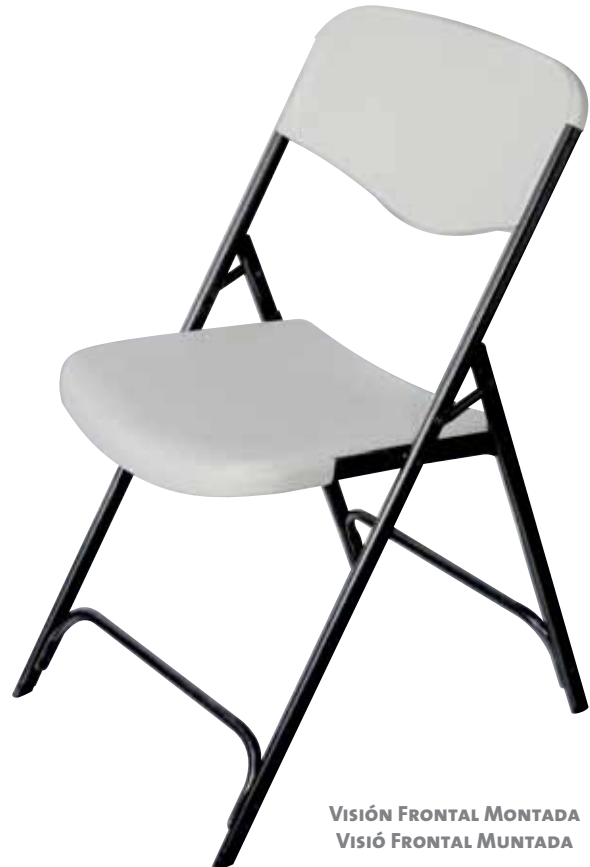
VISIÓN FRONTAL MONTADA VISIÓ FRONTAL MUNTADA