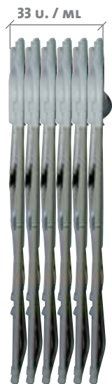
VISIÓN LATERAL PLEGADA Visió LATERAL PLEGADA