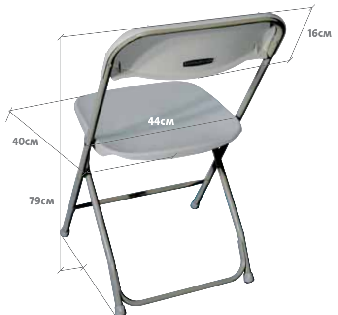
VISIÓN MONTADA TRASERA Visió MUNTADA DEL DARRERE