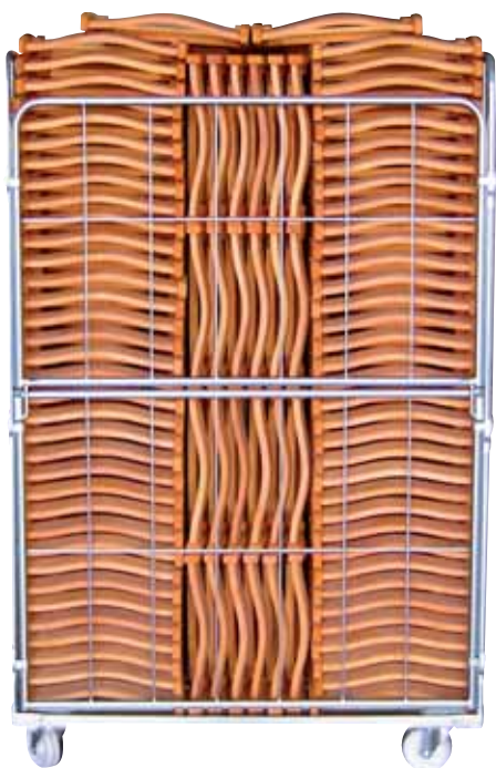
CARRO DE TRANSPORTE PARA INTERIOR (100 U. POR CARRO) CARRO DE TRANSPORT PER A INTERIOR (100U. PER CARRO)