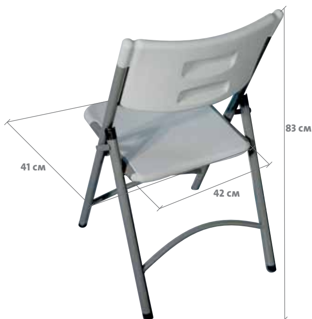
VISIÓN MONTADA TRASERA VISIÓ MUNTADA DEL DARRERE