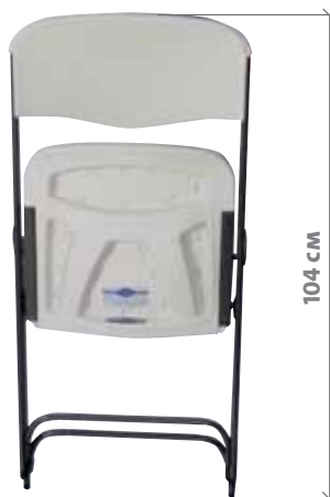
VISIÓN FRONTAL PLEGADA VISIÓ FRONTAL PLEGADA