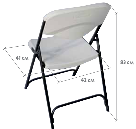
VISION MONTADA TRASERA VISIÓ MUNTADA DEL DARRERE