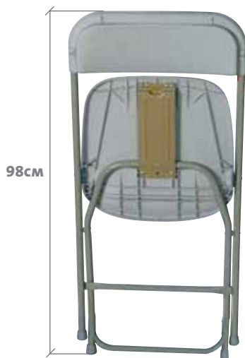
VISIÓN FRONTAL PLEGADA Visió FRONTAL PLEGADA