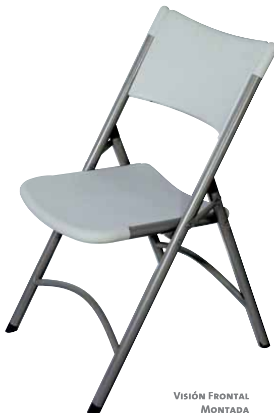
VISIÓN FRONTAL MONTADA