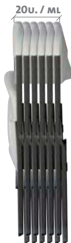
VISIÓN LATERAL PLEGADA VISIÓ LATERAL PLEGADA