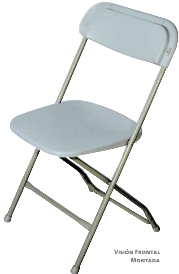
VISIÓN FRONTAL MONTADA